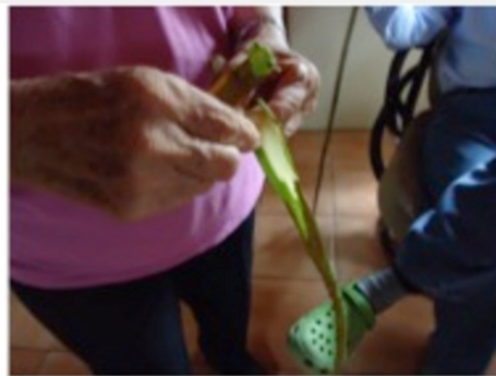
Zapán en proceso. Fotografía: N/A, 2012